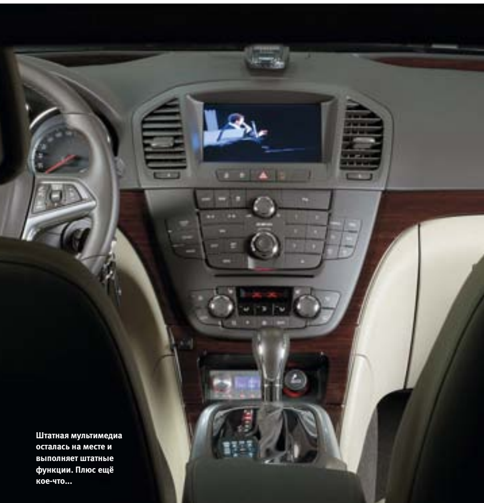
Штатная мультимедиа осталась на месте и выполняет штатные функции. Плюс ещё кое-что...