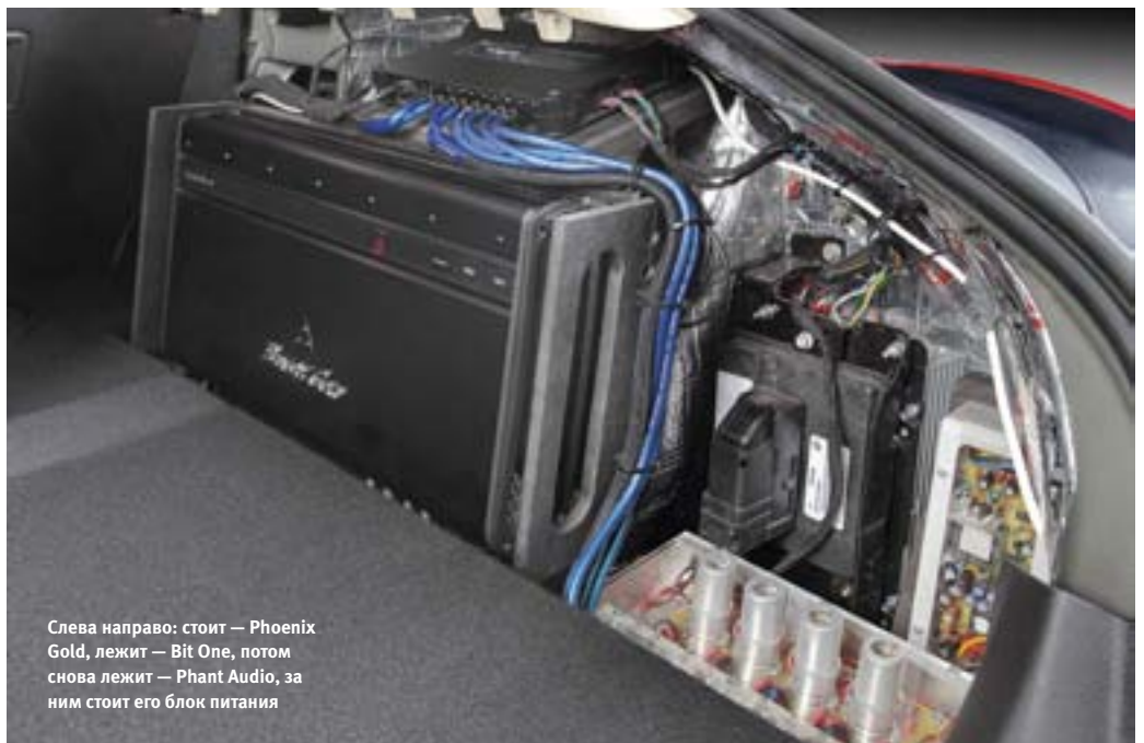
Слева направо: стоит — Phoenix Gold, лежит — Bit One, потом снова лежит — Phant Audio, за ним стоит его блок питания

Загляните в уже упоминавшийся тест сабвуфера «555»: эта головка в этом объёме должна давать именно эту АЧХ — от 80 Гц вниз идёт плавный подъём, не останавливающийся даже на границе слышимого диапазона. Выше по шкале частот видна рука мастера, АЧХ, так сказать, авторская. Единственное, к чему можно было бы придраться — незначительный провал в самом центре среднечастотного диапазона, но практика показывает: провалы (особенно плавные и неглубокие) лучше оставлять, чем вытаскивать эквалайзером. Выше 2 кГц АЧХ идёт как по нитке до 16 кГц, спад на 20 кГц — фирменный почерк мягких куполов Morel.