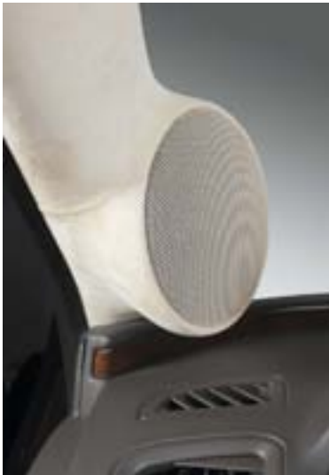
СЧ и ВЧ-головки разместились на вновь созданных рабочих местах...