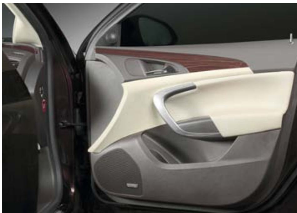
...мидбасы Morel Elate скрылись под штатными решётками с гордой надписью «Infinity»

Построение консерватории в отдельном взятом автомобиле начали с выбора структуры и компонентов системы. Первый вопрос практически не обсуждался —