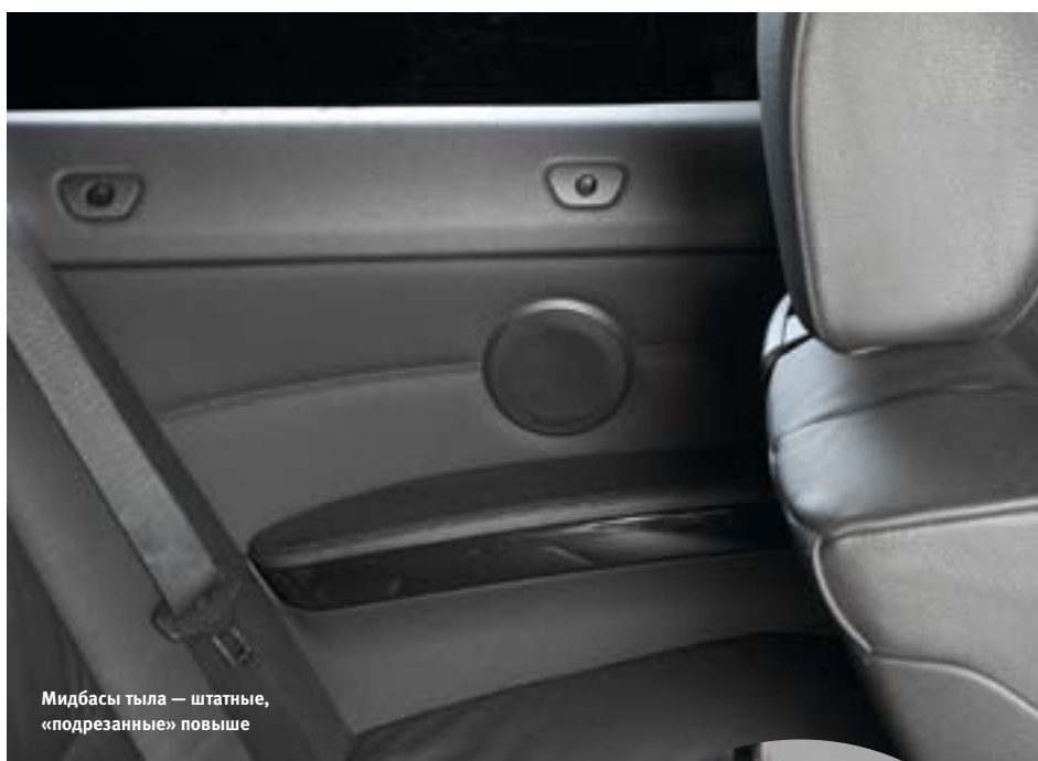
Мидбасы тыла — штатные, «подрезанные» повыше