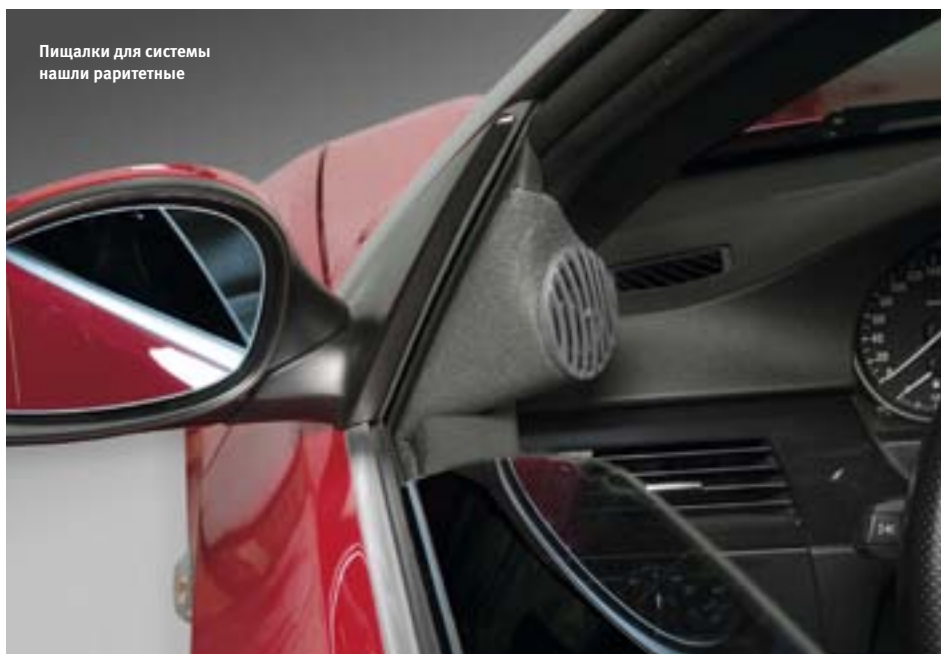
Пищалки для системы нашли раритетные