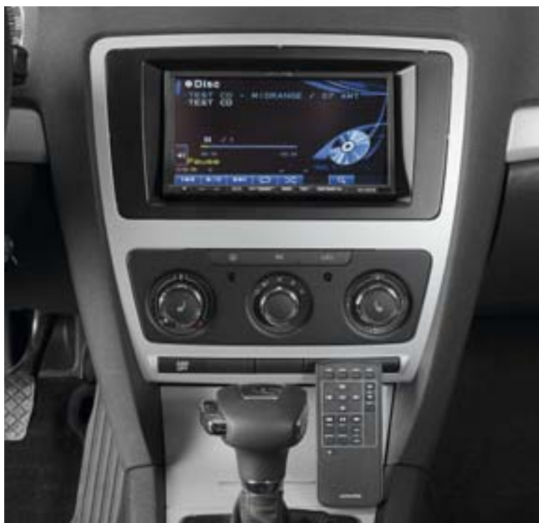
Медиастанция Alpine равно приспособлена для музыки и для кино

Последнее означает, в том числе, без излишеств. Принцип разумной достаточности будет упоминаться ещё не раз и не два — чтобы не тратить буквы, назовём его «принцип РД».