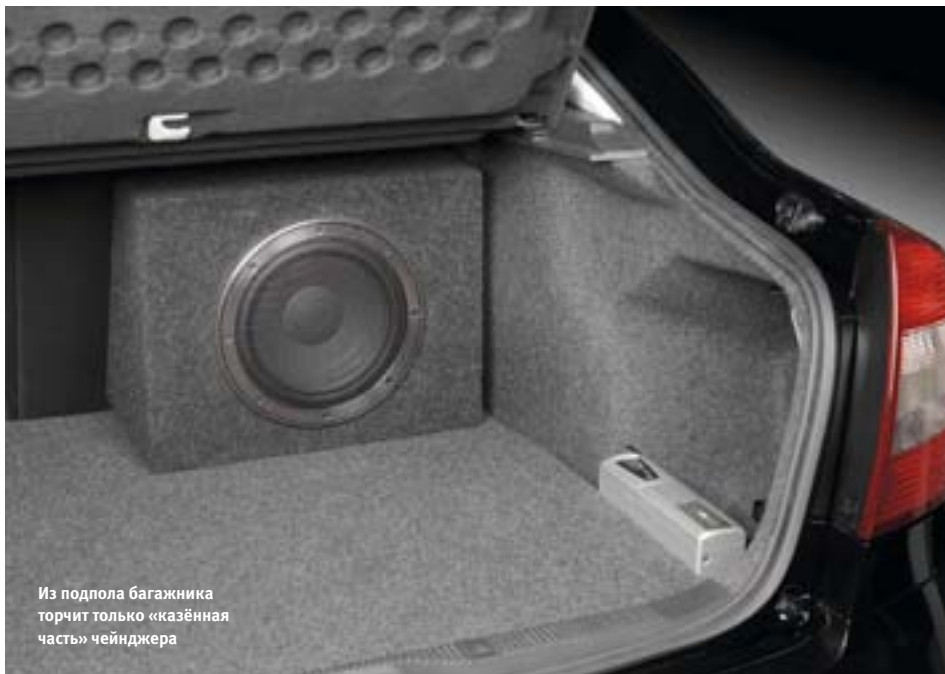
Из подпола багажника торчит только «казённая часть» чейнджера

лых систем с поканалкой его игнорировать. Но, как говорится, вольному воля.