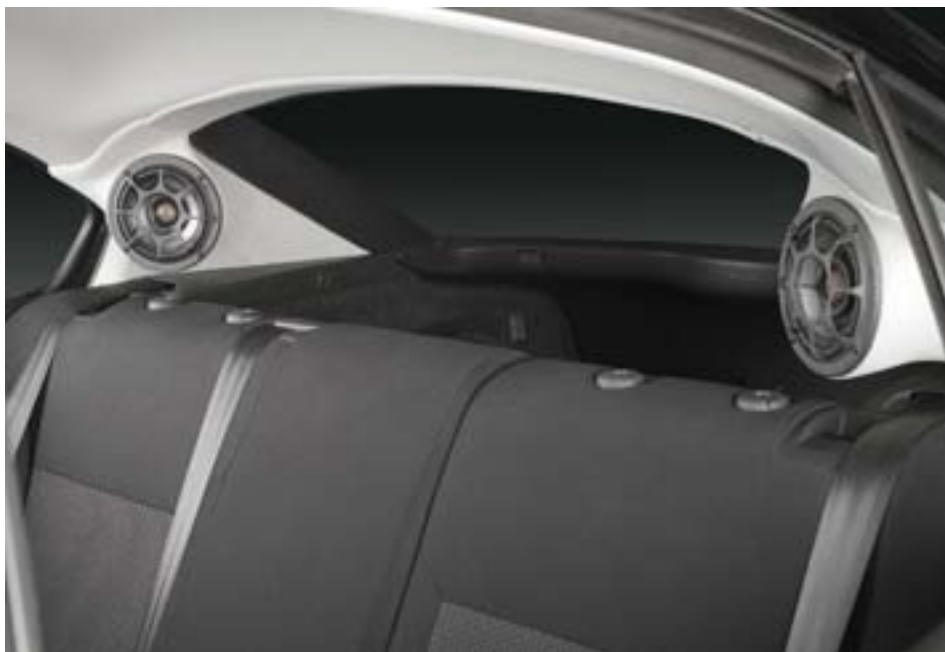
Нечастое, но стильное решение для каналов «сурраунд»: единственные оставшиеся в car audio динамики точечного излучения

обойтись общим каналом усиления средних и высоких частот, а вторую пару каналов зарядить на мидбас. Распределение мощности по каналам низких и средних/высоких частот получается примерно равным, и четырёхканальный усилитель будет работать с оптимальной нагрузкой. Факт такого распределения мощности по спектру науке давно известен, описан, например, в книге некоего Шихатова, а до него — ещё в полусотне источников, что не мешает множеству создателей двухпо-