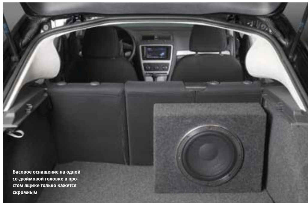
Басовое оснащение на одной 10-дюймовой головке в простом ящике только кажется скромным