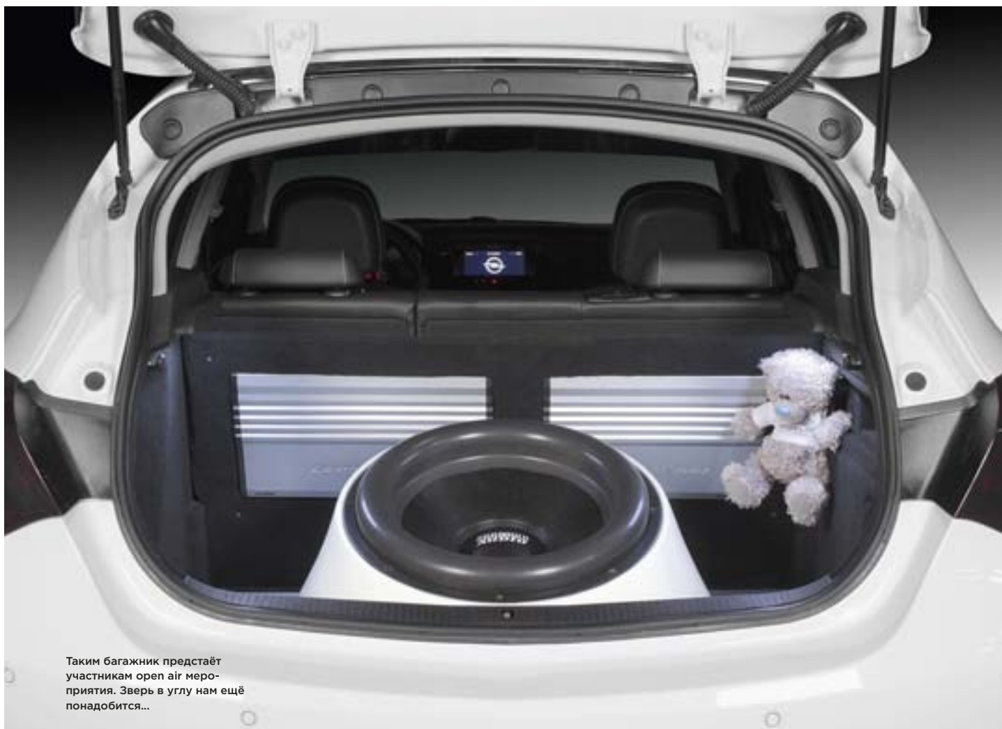
Таким багажник предстаёт участникам open air мероприятия. Зверь в углу нам ещё понадобится...