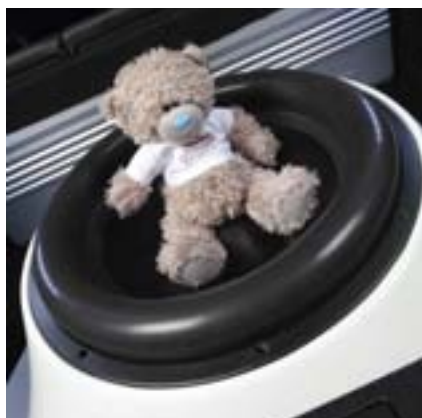
Акустические измерения: если медведь на первой ноте взлетает к потолку — система работает штатно

18 ДЮЙМОВ — ВЕРХНИЙ ПРЕДЕЛ СЕРИЙНЫХ ИЗДЕЛИЙ, А НЕ ДЕМО ЧУДОВИЩ, ПОСТРОЕННЫХ В ОДНОМ ЭКЗЕМПЛЯРЕ