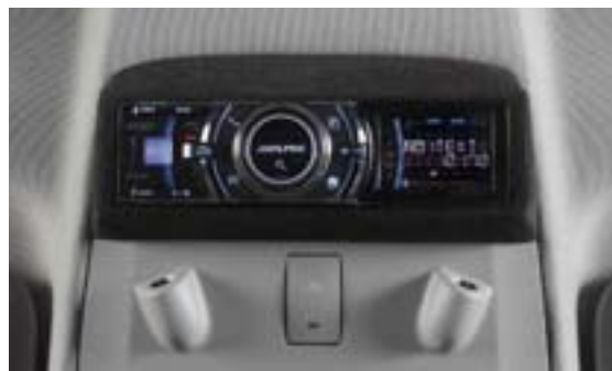
С потолка скромно смотрит вниз панель управления медиаресивером

Пищалки обычного разбора в паре с таким мидбасовым звеном, разумеется, выступать на равных не смогли бы, потому поставили