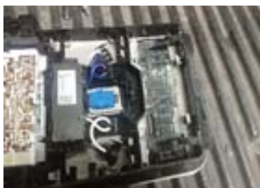
Сурово разнесённая на части «магнитолка» сохранила возможность снятия панели

18 ДЮЙМОВ — ВЕРХНИЙ ПРЕДЕЛ СЕРИЙНЫХ ИЗДЕЛИЙ, А НЕ ДЕМО ЧУДОВИЩ, ПОСТРОЕННЫХ В ОДНОМ ЭКЗЕМПЛЯРЕ