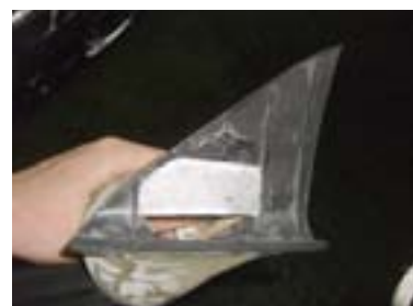
Объём подиума сообщается с объёмом под штатной облицовкой, для сохранения жёсткости вклеена алюминиевая распорка

жил построить у себя в Audi A8 систему в двухполосном варианте с фронтальным басом, где в роли мидбасов (и одновременно — совсем басов) выступили бы 18-сантиметровые сабвуферы Bewith R-180 в передних дверях, а в паре