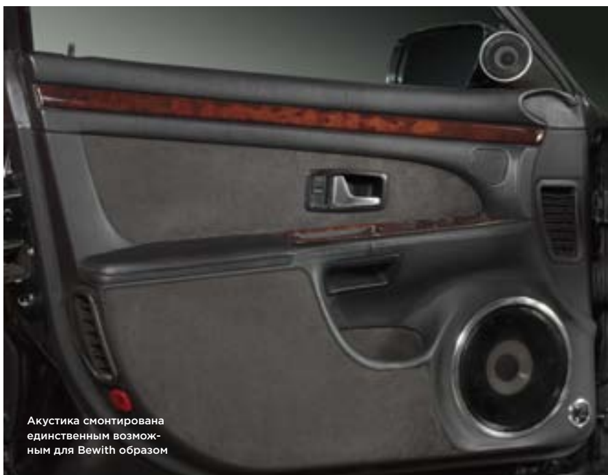
Акустика смонтирована единственным возможным для Bewith образом