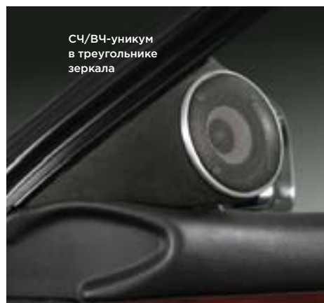
СЧ/ВЧ-уникум в треугольнике зеркала