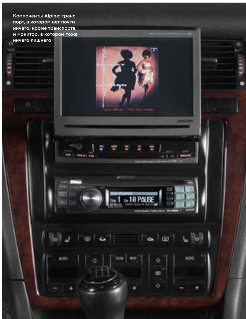
Компоненты Alpine: транспорт, в котором нет почти ничего, кроме транспорта, и монитор, в котором тоже ничего лишнего