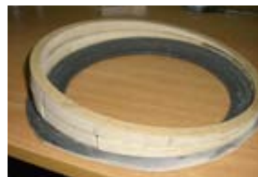
Рабочий момент: изготовление переходных колец под «неметрические» динамики