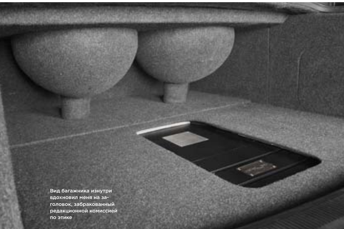
Вид багажника изнутри вдохновил меня на заголовок, забракованный редакционной комиссией по этике