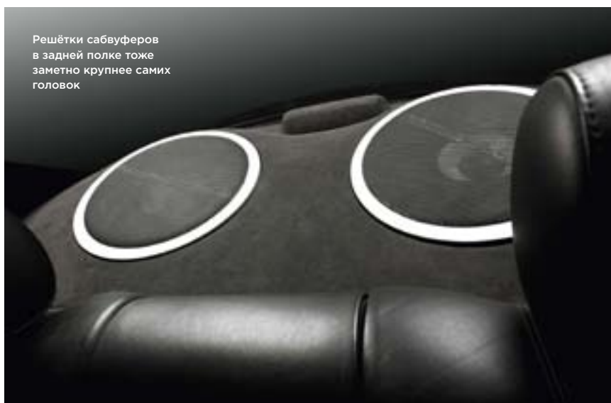
Решётки сабвуферов в задней полке тоже заметно крупнее самих головок

Звучание оказалось хорошим, но далёким от идеала, на который были все основания рассчитывать. Это подтвердило участие в соревнованиях FSQ-2010, ставших, кто ещё помнит, последними. Акустика Bewith в основном оправдала