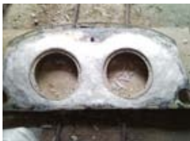
Анатомия источника вдохновения: жёсткая трёхмерная полка и полусферы, дающие в сумме действительно сферу. Или не сферу?